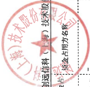
附表：2025年度非经营性资金占用及其他关联资金往来情况汇总表