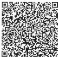
段守凤年检二维码

本证书经检验合格, 继续有效一年。 This certificate is valid for another year after this renewal.