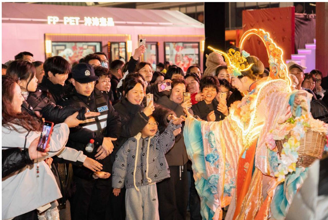
(图 1 “嗨购全球·打卡春晚”义乌小商品城 2026 年游园大集)

首日三个市场打卡点位总客流超 6.1 万人次，其中全球数贸中心主舞台客流超 4.2 万人次。截至正月初七，全域春晚打卡点累计客流突破 130 万人次。