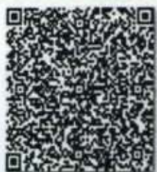
年度检验登记二维码

本证书经检验合格, 继续有效一年。 This certificate is valid for another year after this renewal.