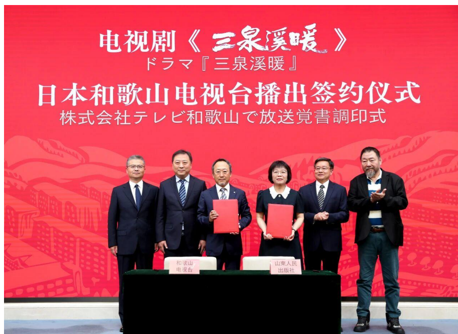
电视剧《三泉溪暖》和歌山电视台播出签约仪式

129家。5月，公司充分利用中日韩出版协作共同体机制，成功与和歌山电视台签署《三泉溪暖》影视剧播放意向书，在讲好中国故事、传播好中国声音，展现可信、可爱、可敬的中国形象方面发挥了积极作用。