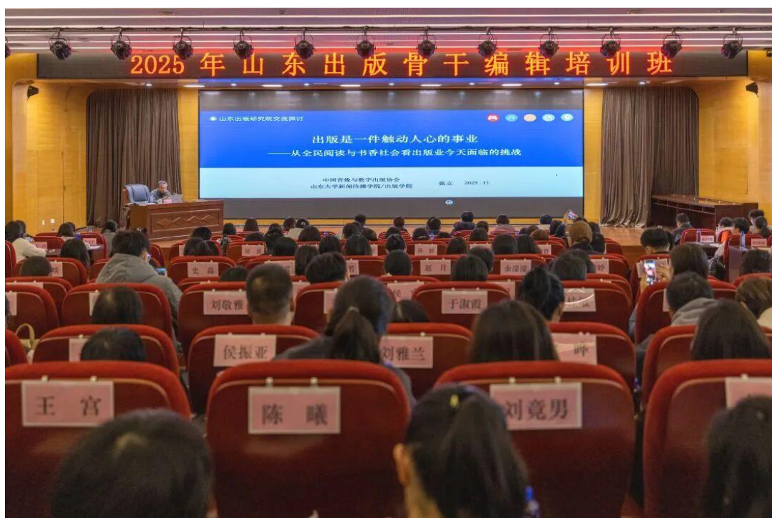
2025年山东出版骨干编辑培训班

项培育计划，持续提升员工专业能力。同时，着力构建清晰畅通的人才成长通道，为员工的职业发展提供坚实平台。优化人才选育用留体制机制建设，打破传统管理壁垒，打造吸引人才、培育人才、成就人才的良性生态。构建多元化培育体系，实施知识提升“四大工程”——面向新员工及入职1—3年青年编辑的小荷培育工程、面向骨干编辑的青年英才工程、面向青年干部的卓越工程、面向中高层管理人员的领航工程。组织出版单位优秀骨干到发行、融合创新等板块基层一线实践锻炼，以实战化培养加速后备人才成长，全面推动一线人才由单一技能向“一专多能”的复合型人才转变。组织骨干编辑培训、入职1—3年青年编辑培训、新员工培训等培训活动，通过加强学习教育助力公司各板块高质量发展。