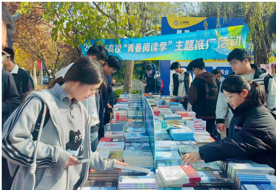
驻济高校“青春阅读季”主题推广活动现场

文化书院”，落地 15 地区、36 家分公司，共计建成 50 家，累计举办读书分享会、公益文化讲座、绘本故事会等各类文化活动 960 余场，活动参与人数超 2.4 万，切实打通了文化惠民“最后一公里”。