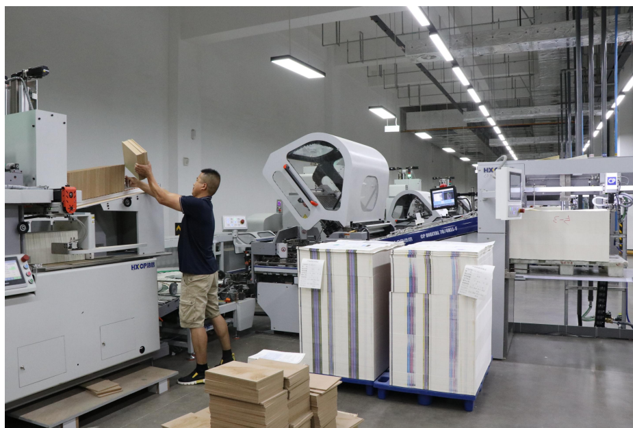
新华印务智能低碳印刷基地开展智能化、自动化改造升级

公司始终坚持绿色低碳发展理念，积极推广环保印刷材料与工艺，从源头减少生产对环境的影响。报告期内，山东新华印务公司针对现有设备开展智能化、自动化改造升级，有效减少了能源消耗与废弃物排放。智能低碳印刷基地项目稳步推进，全面升级 VOCs 治理系统，实现生产废水净化循环和零排放，全线采用 LED 节能照明，并顺利通过 ISO14001 环境管理体系及绿色印刷认证复审。基地光伏装机容量 2.28 兆瓦，年发电量约 325 万度，通过采用集中供气、集中供水、中央空调等节能措施，每天可减少用电 6000 余度，节能效果明显。推进智能生产全覆盖，引进八色轮转印刷机、智能折页生产线等设备，有效提升自动化水平与生产效率。加大数字化能源改造力度，推进信息化管控平台建设，实现生产数据实时监控与优化调度，通过建设智能立体库、部署物流调度系统，初步形成较为完整的全流程智能化生产体系。