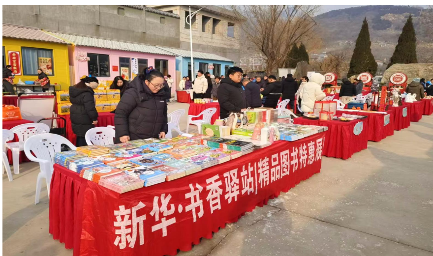
书店集团开展“新华·书香驿站”精品图书特惠展活动

公司充分发挥出版行业文化资源优势，通过村企文化共建、送书下乡、爱心捐赠等形式，提升乡村公共文化服务效能，推动乡村群众精神文化生活水平再上新台阶。书店集团依托 124 家乡镇发行网点组织农村流动售书活动，把阅读服务、文化创新送到居民家门口。开展“新华·书香驿站”“新华·文化市集”等文化活动 600 余场，吸引 60 万人次参与，切实提升文化服务便利性，丰富乡村文化生活。围绕推动地域特色文化创造性转化、创新性发展，通过捐赠村史书籍充实村史志藏书资源等方式，深化“百新联百居”结对共建内涵，搭建企业与乡村文化共兴、发展共享的桥梁。举办“我们的节日·端午”文明实践活动，通过民俗展示、互动体验等形式，让文明实践与文化惠民有机融合。2025 年，爱心捐赠覆盖沂南、郯城等省内脱贫攻坚重点区域及西藏、新疆等地区，实现跨区域文化帮扶，捐赠对象更多元、捐赠服务更精准。