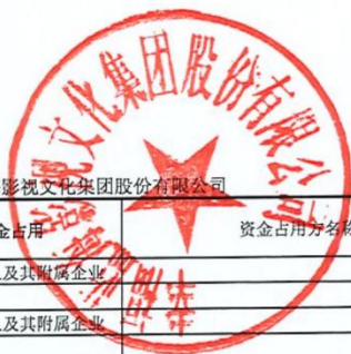
上市公司2025年度非经营性资金占用及其他关联资金往来情况汇总表