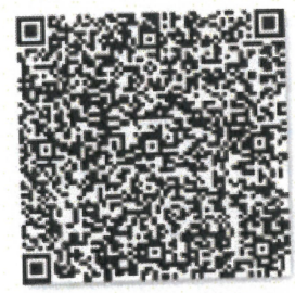
滕忠诚的年检二维码.png