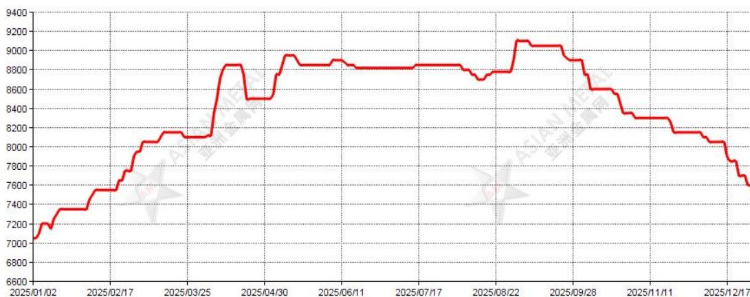
2025 年金属铌价格走势图