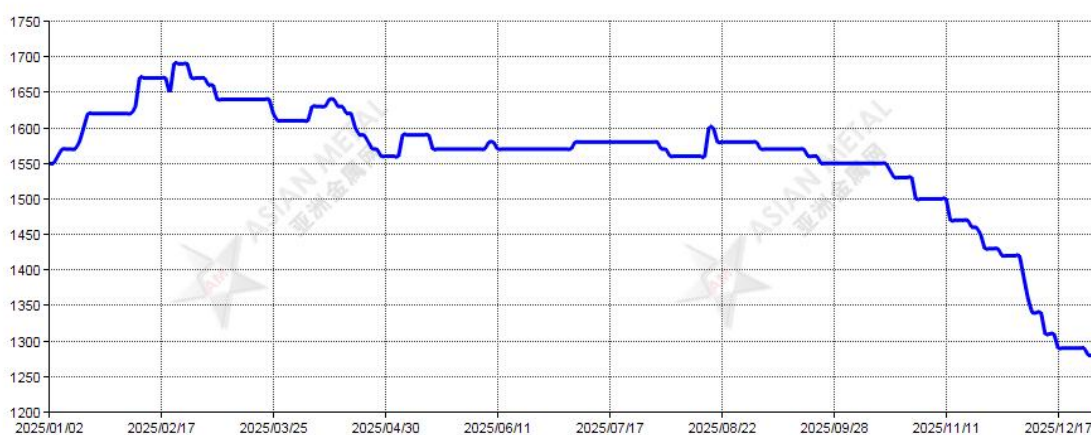
2025 年金属铌铁价格走势图