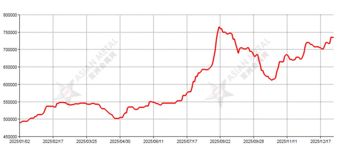
2025 年金属锆钨价格走势图