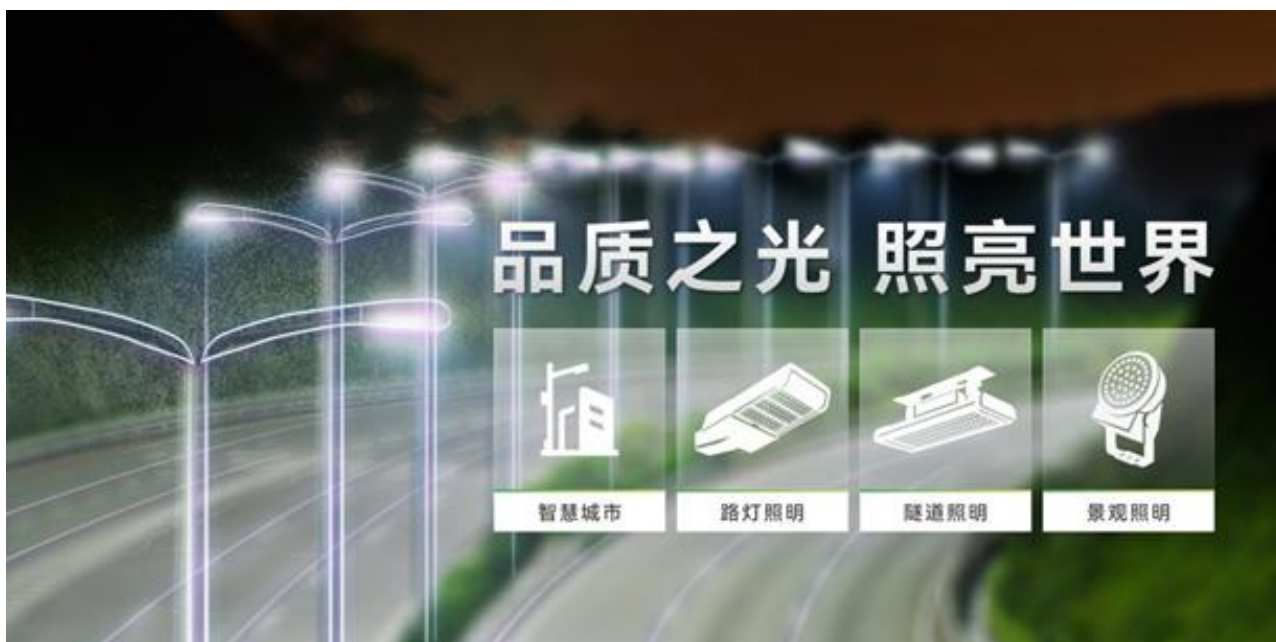
（公司主要产品系列）

公司自主研发和生产的半导体照明产品主要涵盖三大系列：户外照明、庭院照明和景观照明，并涉及部分室内照明及显示屏产品。产品广泛应用于智慧照明、道路照明、隧道照明、商业照明、工业照明等多个领域，参与多个 LED 示范工程和重点照明项目。公司可为细分应用场景提供专业化 LED 照明解决方案，也可为综合性场所提供一站式照明服务。