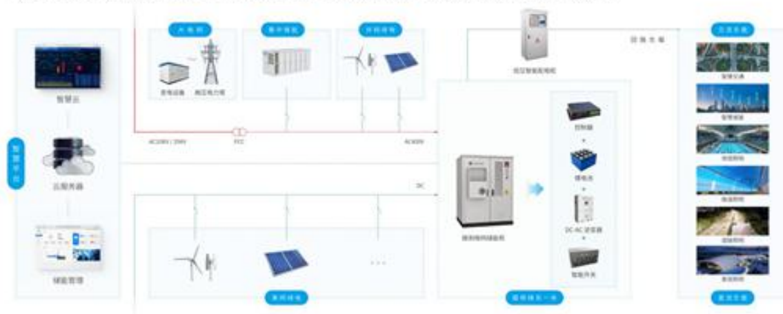
(路侧微网智慧储能方案)

在城市道路沿线建设路侧微网储能，并配套部署高效节能照明终端，构建集能源获取、储存、调度与使用于一体的低碳照明系统。通过“清洁能源+储能+智慧照明”的协同应用，不仅有效减少对传统电网电力的依赖，还显著降低照明系统运行过程中的碳排放，为城市公共照明向深度低碳乃至零碳化转型提供可落地的技术路径。