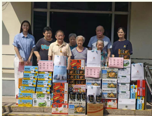
金匯鎮泰日敬老院慰問

報告年度內，本集團在國慶及重陽節前夕探望金匯鎮泰日敬老院中的長者，送上窩心的慰問及食物，共渡溫情洋溢的時光。本集團關懷長者的需要，為敬老院提供了糕點及牛奶送贈予長者。報告期間，本集團投入志願服務人數為2人，志願服務時數約2小時，捐贈人民幣及物資約3,000元。