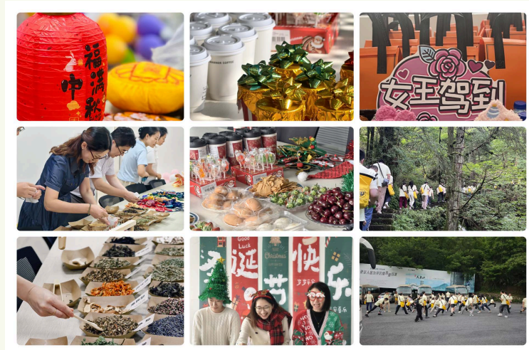
團建活動及節日福利

為培養員工對本公司的歸屬感、促進員工間友誼及建立團隊精神，業務單位定期舉行各種團建活動，在節日時亦會送上禮物和禮券，讓員工與家人分享。