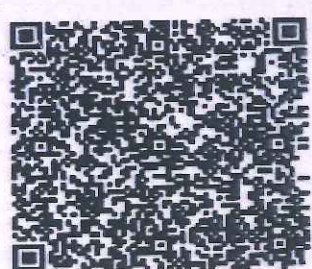
文琼瑶年检二维码

证书编号: 310D6040-187 No. of Certificate 批准注册协会: 上海注册会计师协会 Authorized Institute of CPAs 发证日期: 2024 年 03 月 25 日 Date of issuance