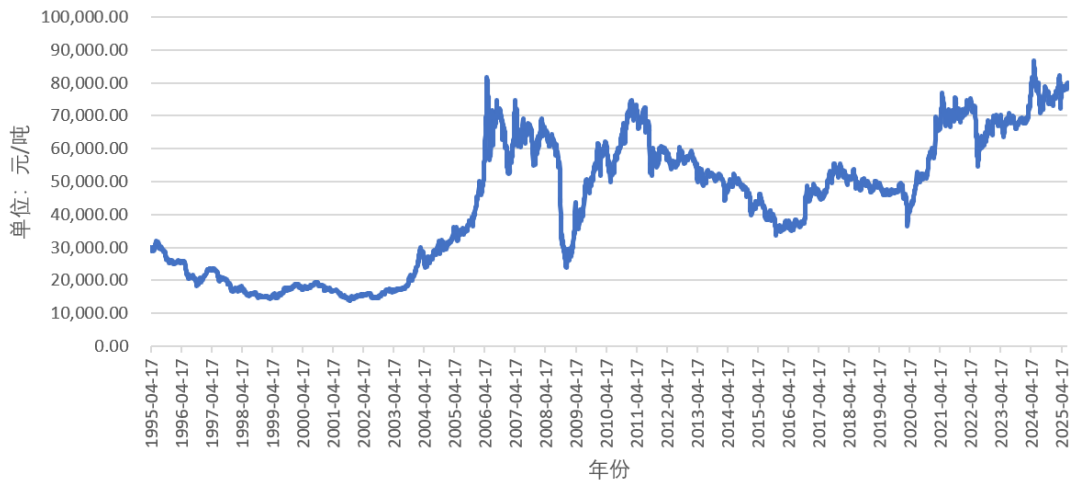
1995年至2025年6月铜价走势图

(2) 本项目建设地位于广东佛山，项目初期部分产品主要用于光伏逆变器中的中小功率机型的电感、变压器等磁性元件绕组。2022 年以来，关于光伏建设的一系列用地政策的出台对光伏项目造成了严重影响。2023 年 9 月，国家林业和草原局办公室发布《关于支持光伏发电产业发展规范使用草原有关工作的通知》，要求新建、扩建光伏发电项目禁止使用基本草原；2023 年 11 月，自然资源部办公厅印发《乡村振兴用地政策指南（2023 年）》，光伏方阵用地不得改变地表形态，以第三次全国国土调查及后续开展的年度国土变更调查成果为底版，依法依规进行管理；2022 年 4 月，广东省发展和改革委员会下发《关于规范集中式光伏电站项目管理有关事项的通知》，对全省光伏项目进行了全面整顿。受上述政策调整的影响，项目相关配套产品产能发挥受到了一定的影响。