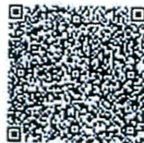
陈影的年检二维码