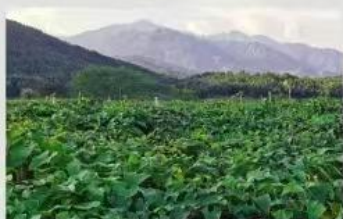
有机罗汉果种植基地

葡萄糖基甜菊糖苷是纯天然的低卡路里甜味剂和风味增强剂；用酶技术修饰甜菊糖苷的分子从而达到改善甜菊糖的后苦涩味，增强水溶性，同时也保证了甜菊糖的天然和低热值的特性。