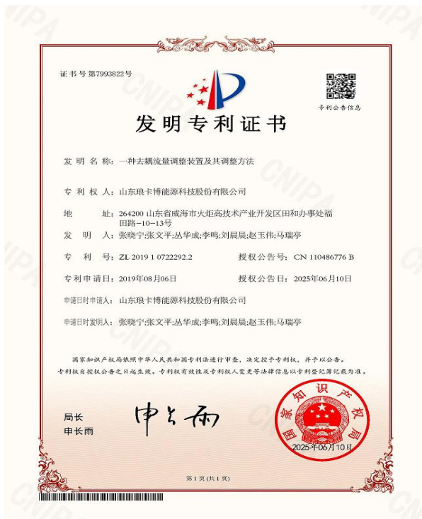
发明专利：一种去藕流量调整装置及方法

2025 年获专利授权 15 项，其中发明专利 2 项，实用新型 13 项，软件著作权 3 项。