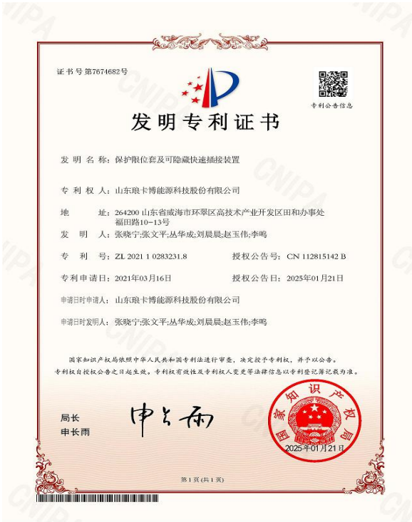
发明专利：保护限位套及可隐藏快速插接装置