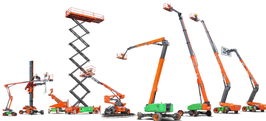
图：公司产品概览图

公司从事各类智能高空作业平台的研发、制造、销售和服务，公司产品主要应用于工业领域、商业领域和建筑领域，覆盖建筑工程、建筑物装饰与维护、仓储物流、石油化工、船舶生产与维护，以及诸如水电站、核电站、国家电网、机场、隧道等工况。