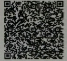
白露的年检二维码

白露(310000062537) 您已通过2021年年检 上海市注册会计师协会 2021年10月30日