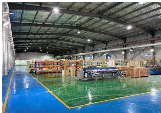
复合材料生产车间

报告期内，公司复合材料业务实现营业收入 1.14 亿元，同比下降 29.97%，主要受市场需求波动及部分项目执行节奏影响。主要企业亚德材料成功通过国家高新技术企业认定，并入库浙江省专利产业化“金种子”企业。