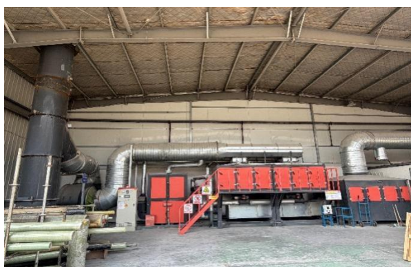
复合材料生产车间