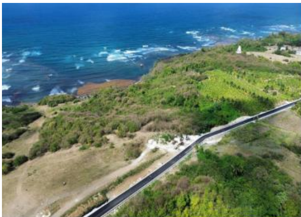
巴巴多斯苏格兰地区道路修复项目

(4) 阿塞拜疆日出光伏项目：项目核心设备采购工作已全面完成，现场土建施工已分区全面展开。