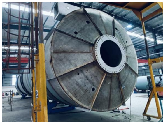
天津新和成危废处置项目