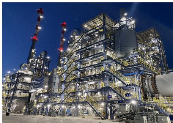
山东裕龙产业园危废焚烧项目