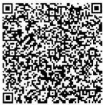
马静的年检 二维码

本证书经检验合格，继续有效一年。 This certificate is valid for another year after this renewal.