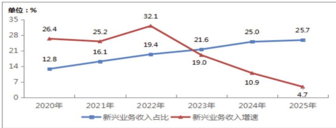
图表 2 2020—2025 年新兴业务收入发展情况