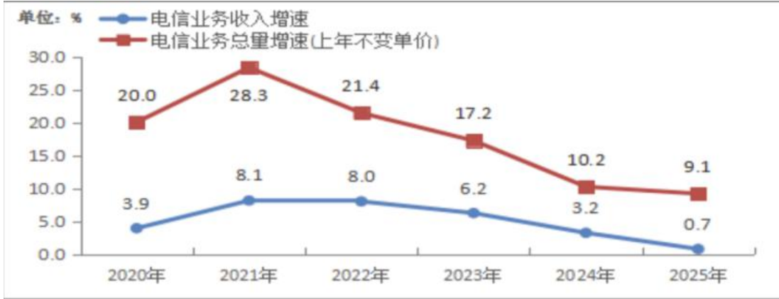
图表 1 2020—2025 年电信业务收入和电信业务总量增长情况

2025 年移动短信业务量增长较快，全国移动短信业务量 23020 亿条，同比增长 14.2%，移动短信业务收入同比下降 2.4%，整体呈现量升价跌趋势。