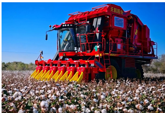
图 4：增程式打包采棉机、粮食烘干塔

公司始终坚持创新驱动发展战略，持续完善创新体系、强化成果转化，不断激活企业高质量发展的内生动力。报告期内，持续保持高强度研发投入，研发费用达 6,496.75 万元，占营业收入的 6.78%，为技术创新与产品迭代提供坚实保障。同时，深化产学研协同创新机制，牵头组建兵团首批制造业中试平台——“棉花收获与加工装备制造业中试平台”，新增“棉花加工装备关键构件服役与可靠性智能控制”“高端智能农牧作物收获装备”2 个市级重点实验室。聚焦“规模化、智能化、绿色化”发展方向，强化关键核心技术攻关，完成新型系列皮清机、大型轧花机、70 包打包机、皮棉图像三丝机等棉机产品，以及增程式与高密度打包采棉机、棉花秸秆打捆机、系列化粮食烘干塔、籽粒收获机等多项新产品、新技术的研发和测试工作。凭借突出的创新实力与行业影响力，报告期内公司及子公司获评 2025 年度山东省装备制造业创新示范企业、兵团重点产业链链主企业等多项称号，相关技术、产品斩获兵团科技进步奖一等奖、山东省装备制造业技术进步奖一等奖、山东省机械工业科学技术奖一等奖等多项荣誉。