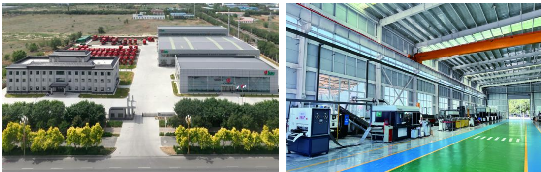
图 5：胡杨河天鹅智慧农业服务中心及自动化锯片生产线

公司始终坚持“质量为本、服务至上”的经营理念，深化质量与服务双轮驱动，筑牢可持续发展根基。首先，多维发力，夯实质量强基。一是优化质量管理体系。以“质量提升行动”“全面对标世界一流行动”为抓手，强化生产全流程管控，完善关键工序质控点，升级专用设备配置，积极构建全员、全程、全方位质量生态，提升产品质量和稳定性。二是推进生产数字化升级。报告期内，国内首条棉花加工关键零部件锯片自动化生产线在胡杨河天鹅顺利投产运行、子公司新疆天鹅“云边端协同的采棉机智能工厂”成功入选兵团首批 5G 智能工厂、主要子公司 MES 系统与 WMS 系统顺利启用。三是强化管理体系标准化建设。公司及主要子公司新疆天鹅、野田铁牛顺利通过 ISO 14001 环境管理体系、ISO 45001 职业健康安全体系、ISO 50001 能源管理体系等多项体系认证。子公司野田铁牛获评“内蒙古自治区绿色工厂”，并成功入选 2025 年内蒙古自治区级绿色制造示范单位，绿色发展能力持续提升。