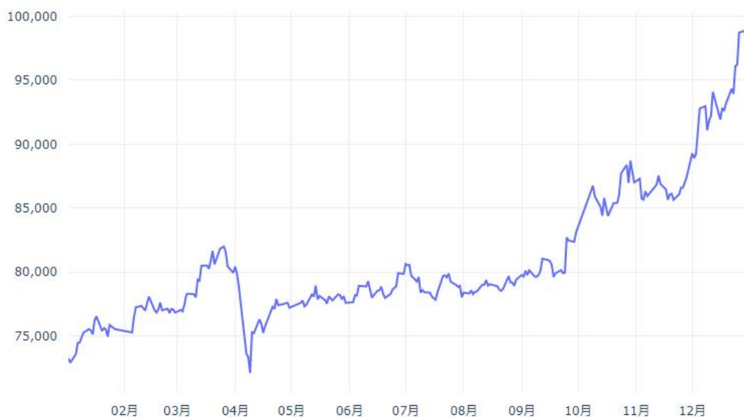
2025年SHFE铜期货价格趋势

黄金：黄金价格在 2025 年呈现持续上涨趋势，主力期货合约价格从年初的 635 元/克上涨至年末的 985 元/克，涨幅高达 55.1%，成为表现最强劲的贵金属。基本面方面，宏观环境上美联储进入降息周期，美元走弱且实际利率下降，为黄金提供了有利的货币环境。同时，地缘政治不确定性增加推动避险需求，各国央行持续购金进一步支撑了黄金需求。此外，全球通胀压力也支撑了黄金作为抗通胀资产的需求，多重因素共同推动了黄金价格的强劲表现。