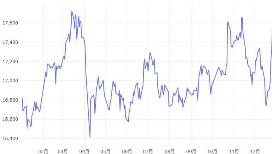
2025年SHFE铅期货价格趋势

铜:铜价在 2025 年呈现强劲上涨趋势,主力期货合约价格从年初的 73,833 元/吨上涨至年末的 88,217 元/吨,涨幅达 19.5%,成为工业金属中表现最强劲的品种。基本面方面,供应端全球铜矿开采量增速放缓,供给增长有限,同时美国将铜纳入关键矿物名单引发贸易流扭曲,大量铜为规避关税风险提前流入美国,导致COMEX铜库存突破 40 万吨高位。需求端则受益于新能源车单车用铜量增至 83 千克(传统车 30 千克)、光伏装机用铜 5000t/GW,以及AI数据中心等新兴领域需求快速增长。根据国际铜研究组织(ICSG)预测,2025 年全球精炼铜市场预计小幅过剩 17.8 万吨,但市场预期 2026 年可能转为短缺 15 万吨,这种供需格局的预期变化为铜价上涨提供了基本面支撑。