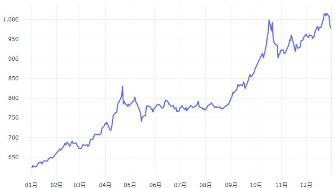
2025年SHFE黄金期货价格趋势

白银：白银价格在 2025 年表现最为抢眼，主力期货合约价格从年初的 7,714 元/千克上涨至年末的 15,981 元/千克，涨幅高达 107.2%，波动性也最大。基本面方面，白银兼具工业与金融双重属性：工业属性上，光伏、电子等工业领域需求持续增长；金融属性上，白银跟随黄金上涨但波动性更大。供需关系方面，工业需求增长与供给约束共同推动了白银价格的强劲上涨。