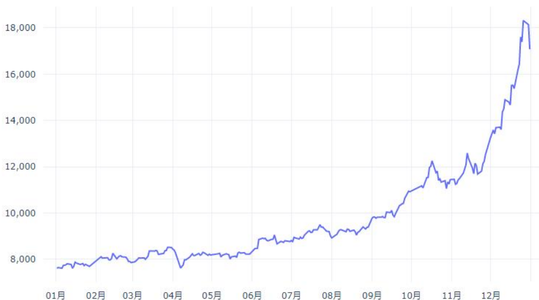
2025年SHFE白银期货价格趋势