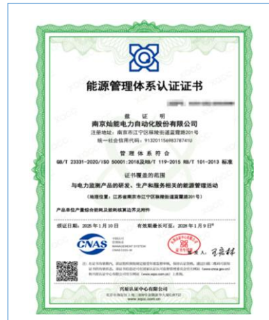
取得能源管理体系认证证书

报告期内，参与起草了《电能质量监测设备通用要求》《公用配电网电能质量工程的治理效果评价方法》《配电网谐波溯源技术导则》《屋顶光伏接入公用电网电能质量预估技术规范》《电压暂降事件数据聚合方法》《配电网谐波谐振评估技术导则》的标准；新增专利 4 项，软件著作权 8 项。