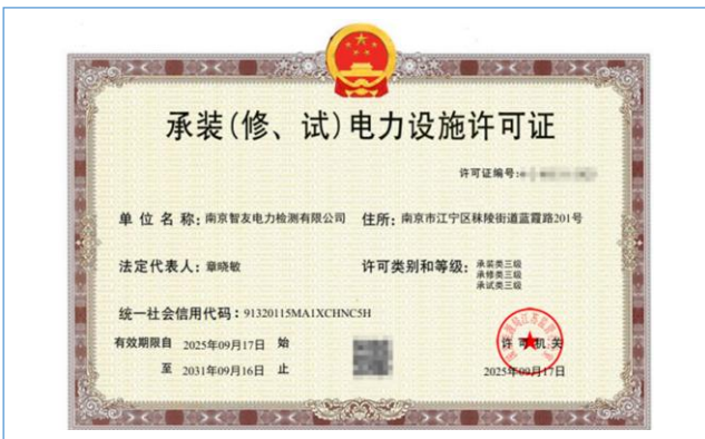
全资子公司智友检测获得承装（修、试）电力设施许可证（三级）资质