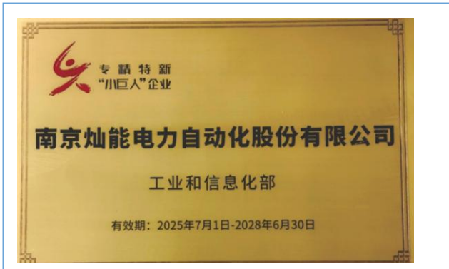
荣获国家级专精特新“小巨人”