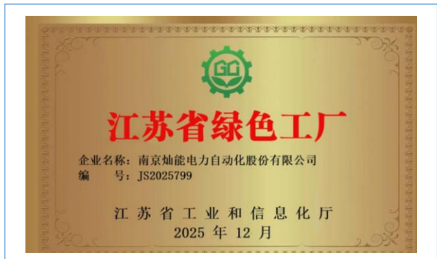
荣获江苏省绿色工厂