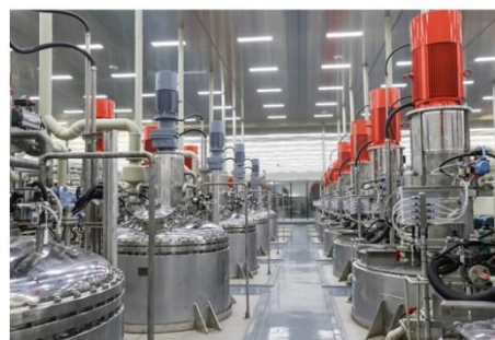
伟明盛青前驱体车间