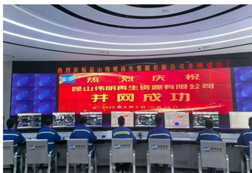
昆山再生资源项目并网成功