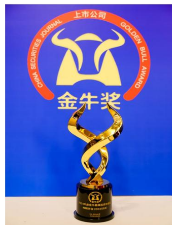
2024年度最具投资价值金牛奖