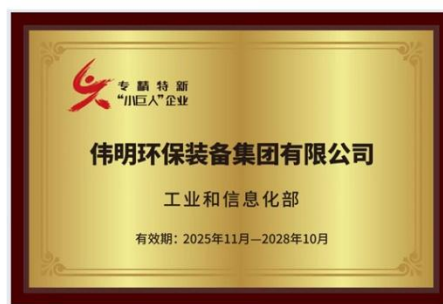
专精特新“小巨人”企业