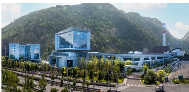
伟明装备集团装备制造产业基地

2025 年度，公司及下属装备制造公司新增设备订单总额约 46.35 亿元，并成功拓展深圳盛屯集团有限公司等重要战略客户。由于订单执行进度等原因，报告期内公司设备、EPC 及服务收入有所下降，2026 年努力加快订单执行和交付。伟明装备集团持续推动技术创新与产品研发，成功开发氧压釜搅拌器、双锅跳汰机、研磨机、隔膜泵单向阀、吊车机器人、智能燃烧控制系统及黑匣子系统新产品，积极拓展光伏业务，实现盛青二期、装备厂区、东阳、文成等多个屋顶光伏项目并网发电。产能布局方面，伟明装备集团度山基地一期已完成达产验收，二期新增取得 52 亩扩建用地，计划进一步提升装备制造能力。凭借在技术创新与专业能力方面的突出表现，伟明装备集团于本年度获评为工业和信息化部专精特新“小巨人”企业及省级企业技术中心，行业地位与核心竞争力持续增强。报告期内，伟明装备集团累计获得产业政策奖励及研发补助约 2,706 万元。