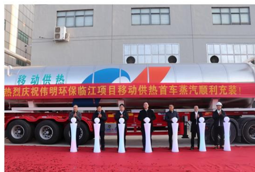
临江项目二期对外供蒸汽