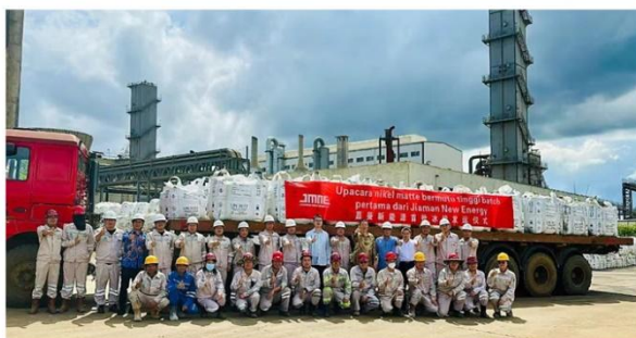
嘉曼项目首批产品发运

新能源集团持续推进产业布局，拟出资人民币 8,000 万元，参与福建泉州年产 6 万吨碳酸锂项目 10% 权益的投资。报告期内，嘉伟新能源集团累计获得产业政策奖励及研发补助约 1,477 万元。