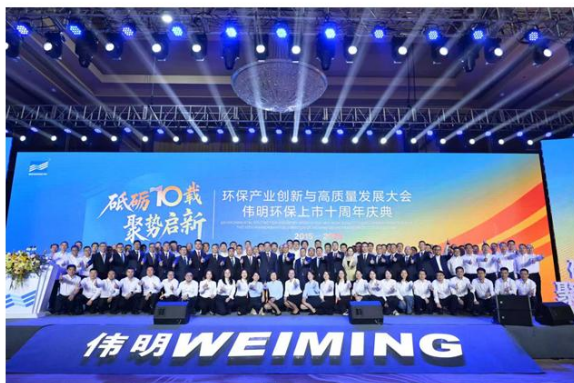
环保产业创新与高质量发展大会