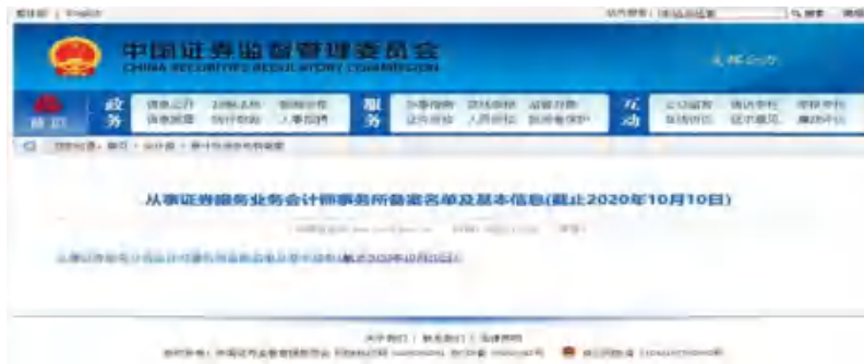
从事证券服务业务会计师事务所名单