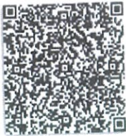
贺爱维的年检二维码.png

本证书检验合格, 继续有效一年。 This certificate is valid for another year after this renewal.