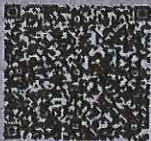
姜蕊的年检二维码

本证书经检验合格，继续有效一年。 This certificate is valid for another year after this renewal.