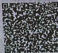
毛明明年检二维码

本证书经检验合格, 继续有效一年。 This certificate is valid for another year after this renewal.