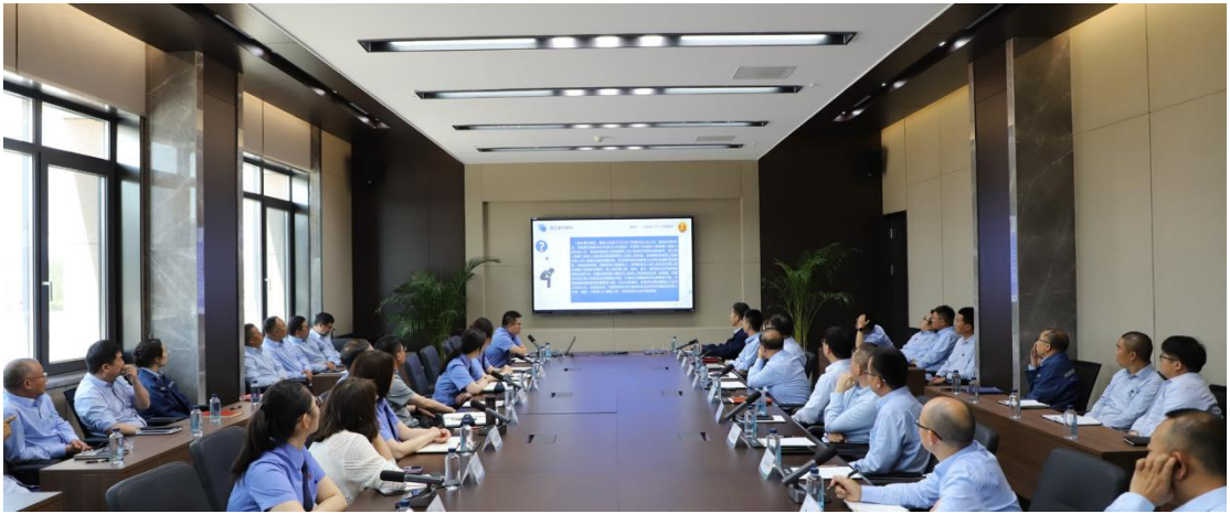
普法活动专题培训

2026年，公司将继续保持稳健的财务状况，持续夯实数字化管理与全面风险防控体系。一方面，深化数字技术在生产运营与管理环节的全域应用，推动更多关键生产单元实现智能化自主运行，加速管理流程全面数字化转型；另一方面，严守安全环保底线，并将其打造为核心竞争优势。同时，持续强化由审计、法务、内控协同构成的全方位风险防控体系，确保公司行稳致远，实现更高质量、更可持续的发展。