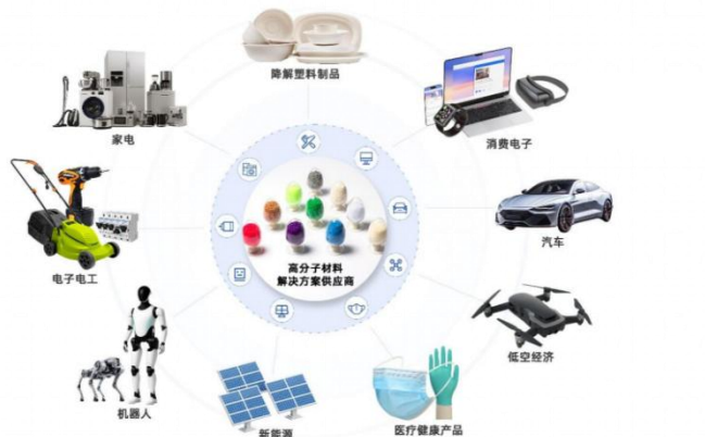
图 1 公司主要产品及应用

料”，下同)、轻烃及氢能源、聚丙烯树脂、苯乙烯类树脂和医疗健康高分子材料等九大类别。产品广泛应用于汽车、家电、电子电工、消费电子、具身智能、新能源、航空航天、高端装备、绿色包装、医疗健康等行业，并与众多国内外知名企业建立了战略合作伙伴关系。