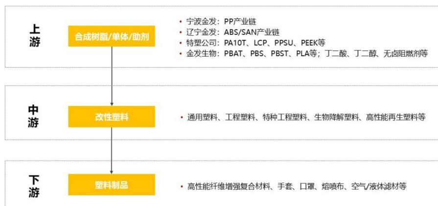
图 2 公司主要产品关系图