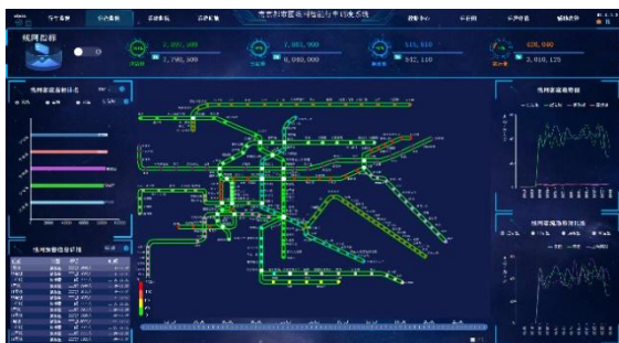
线网智能调度系统

公司以自主可控的信号系统为核心，推动“专业系统+运营维护”业务发展。拥有信号系统系列化的技术和产品谱系；提供城轨数智运营解决方案，覆盖设备维修和生产管理，构建全数字化的运维保障服务模式，提升轨道线路的安全水平、运营效能和服务品质，服务城轨数字化、智能化、智慧化建设，为国家交通强国、乘客美好出行贡献力量。