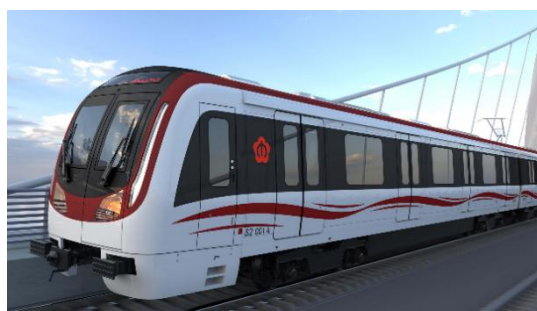
南京 S2 宁马线-ATO+信号系统