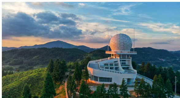
S 波段双偏振相控阵天气雷达

工业软件及智能制造板块 ，公司围绕工业产品全生命周期主线，在国际对标、国内应用迭代的基礎上，基于统一底座打造了丰富的工业软件产品组合。公司通过自身的技术和服務，將领先的智能制造理念和最佳实践融入信息化系统中，为客户提供包括智能研发、智能生产、智能保障、智能管理、知识工程在内的智慧企业信息化解决方案。服务的行业覆盖航空、航天、船舶、兵器、国防电子、核、汽车、轨道交通、工程机械、能源、高科技电子、重型装备、水电等领域，服务的行业知名客户千余家，助力多个国家重大型号的顺利推进。