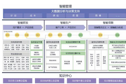
工业软件整体解决方案

智慧轨交板块 ，公司围绕“国产自主化、智能智慧化、绿色低碳化”发展战略，致力于在城市轨道交通智慧运行与运营领域，为地铁建设、运营等地铁业主提供智能列车运行、智能调度指挥、智能运维安全、智慧乘客服务等系列产品和解决方案。