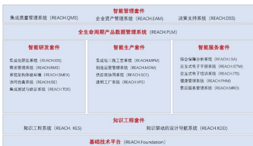
公司工业软件产品谱系

公司通过数字化技术和先进业务实践的融合，帮助工业企业利用信息技术打造高效顺畅的产品全生命周期数字链，重塑和改造产品研发设计、生产制造、运维保障及经营管理方式，实现企业数字化转型。公司依托自主工业软件品牌“REACH 睿知”和智能制造装备品牌“REASY 睿行”，推进智能制造软硬协同发展，面向防务、民用装备、科研院所等市场推广应用整体解决方案，赋能制造业转型升级和提质增效，服务制造强国和数字中国建设。