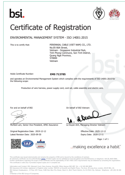
ISO 14001: 2015越南證書