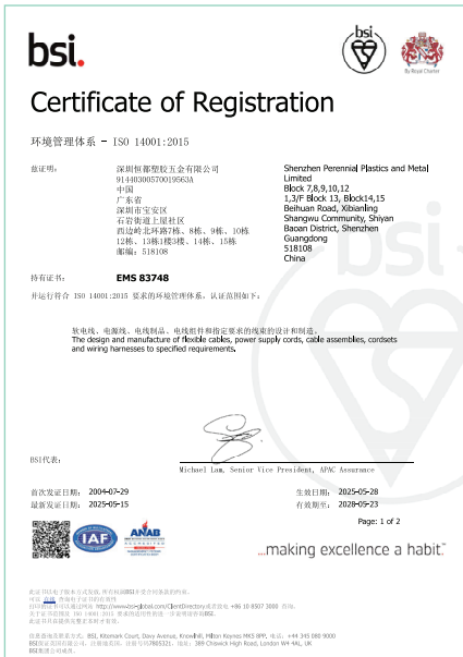
ISO 14001: 2015中國證書

為減少營運對環境造成直接影響，本集團在中國及越南分別落實了《環境污染防治控制程序》及《職業健康安全與環境政策》，以控制營運過程中產生的廢水、廢氣、噪音及廢棄物。此外，我們每年在越南工廠進行兩次內部評估。此舉可確保本集團的環境表現符合中國及越南環保法規的規定。此外，本集團在中國及越南的生產現場的環境管理系統已獲得ISO 14001認證。