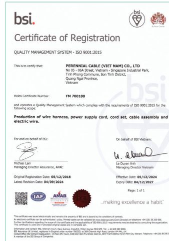
ISO 9001 : 2015 越南證書