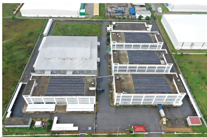
越南廠房的建築物A、B、C及E屋頂安裝太陽能板

密度為每噸產量能源消耗900千瓦時。本集團2021年能源使用密度為每噸產量709千瓦時，即本集團於本報告期間內能源使用密度較基準年增加27%。基於此等結果，如該等能源消耗增加的數字在下個報告期間持續，本集團可能考慮重新評估其10年能源使用密度減少目標。