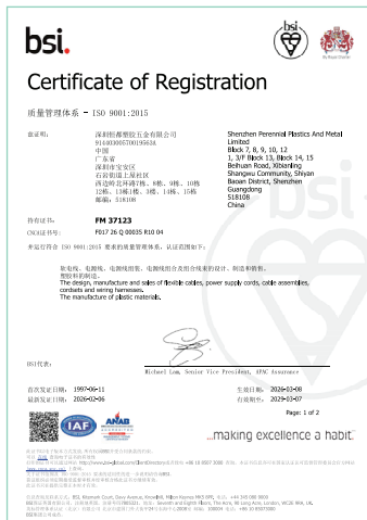
ISO 9001 : 2015 中國證書

本集團承諾為客戶提供高品質、安全的產品。本集團位於中國及越南的生產現場已落實嚴格的內部品質控制程序，並均已通過ISO 9001品質管理體系認證，監控整個生產過程及產品質量，包括確保產品的一致性，預防和糾正不符合規範的產品。本集團亦會對所有產品進行全面品質檢驗，只有通過檢驗的產品才能進入下一道工序。而在原材料管理方面，本集團要求所有產品的原材料必須符合相關的產品安全和環境要求(如RoHS)。例如，產品只使用銅含量在99.96%以上的銅線作為原料，以保證具有較高的能源效益。藉由嚴格的產品質素控制，本集團的產品質量得到了不同國家客戶的認可。