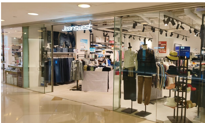
● Jeanswest致力為顧客提供物超所值的服裝產品

於2025年，Jeanswest處理了1宗客戶投訴個案(2024年：3宗)，當中主要涉及貨品拉鏈設計不符預期，並沒有牽涉產品的安全與健康理由而需要回收。