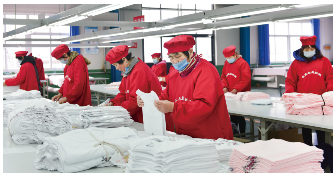
● 本集團向供應商推行社會責任評核工廠制度