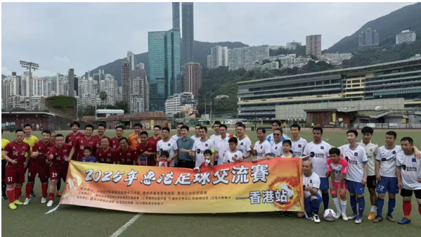
● 本集團足球隊與其他企業球隊比賽交流