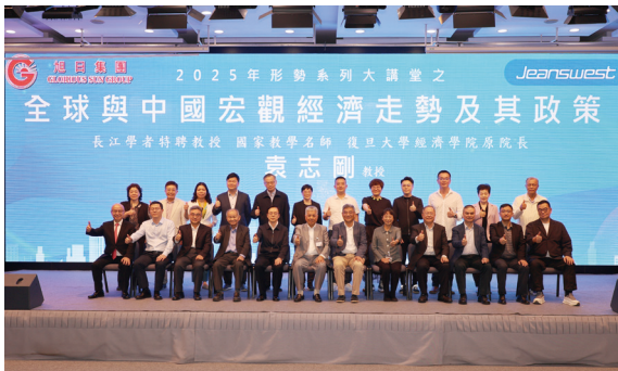
● 「全球與中國宏觀經濟走勢及其政策」講座

隨著人工智能(「AI」)愈趨受重視，本集團舉辦多個AI工作坊和專題講座課程，讓員工認識最新的AI技術、如何透過AI提升工作效率，以及AI的利與弊；包括「數智時代學科交叉融合的時尚創新探索」、「人工智能賦能企業發展」、「AI賦能數據統計與分析」課程，邀請老師以實例講解AI在企業的應用實踐；此外，亦舉辦多項沉浸式培訓課程，包括「沉浸式可持續發展之星際探險隊」和「飛越合作－提升團隊效能」等，讓員工在情境模擬下擔當不同的角色，合作完成各項任務，進一步促進員工的創新和協作能力。