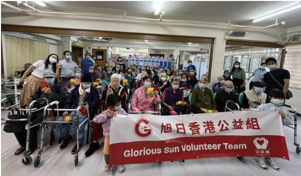
● 本集團香港公益組於中秋節到訪安老院慰問長者