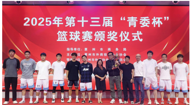
● 本集團籃球隊與其他企業球隊比賽交流