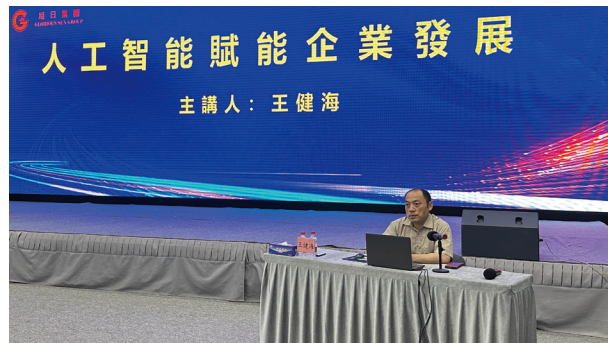
● 人工智能賦能企業發展