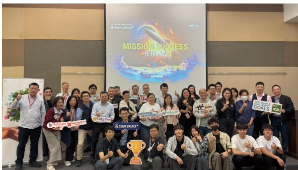
● 「沉浸式可持續發展之星際探險隊」課程