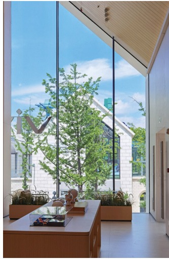
● 常宏為vivo昆明1903影像館提供店裝服務