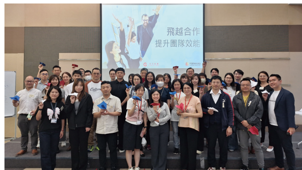
● 「飛越合作－提升團隊效能」課程