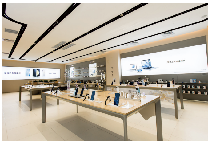
● 常宏為榮耀東營西城萬達店提供店裝服務