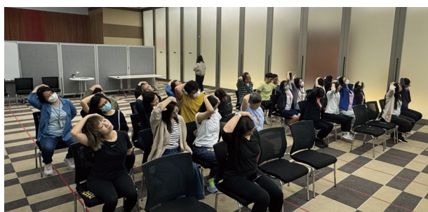
● 「鬆一鬆：紓緩辦公室痛症伸展運動班」