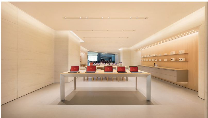
● 常宏為華為智慧生活館－天津濱海國際機場店提供店裝服務

本集團的室內設計及裝修工程業務以「石家莊常宏建築裝飾工程有限公司」(「常宏」)經營；服裝出口業務主要以「力佳實業有限公司」(「力佳實業」)及「永佳設計中心有限公司」經營；本集團以「Jeanswest」品牌經營的服裝業務網絡分佈在香港，並以海外加盟模式於東南亞和其他地區經營「Jeanswest」的加盟業務。