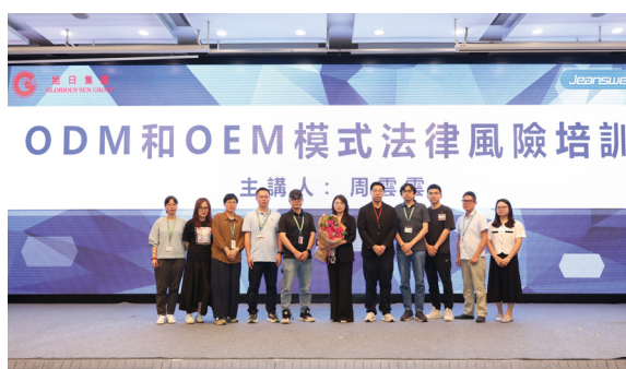
● 「ODM和OEM模式法律風險培訓」講座