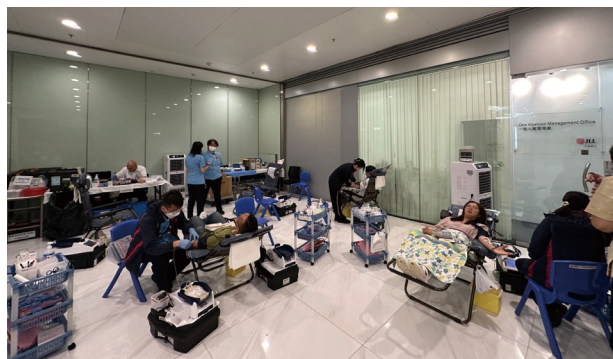
● 本集團香港公益組推動捐血日