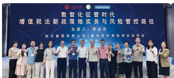
● 「增值稅法新政落地實務與風險管控路徑」講座

本集團中國總部亦舉行多場與服裝行業相關的課程講座，包括「智能時代背景下的品牌服裝產品供應鏈」、「服裝企業風險管理防範」、「ODM和OEM模式法律風險培訓」講座；邀請國家財稅專家、高級會計師主講「增值稅法新政落地實務與風險管控路徑」講座，分析增值稅法對企業產生的影響。