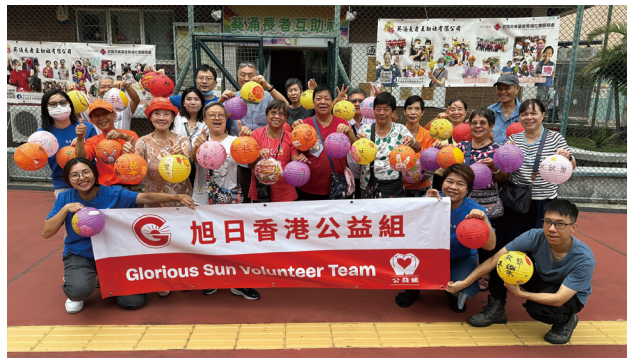
● 本集團香港公益組為長者送上溫暖及關愛