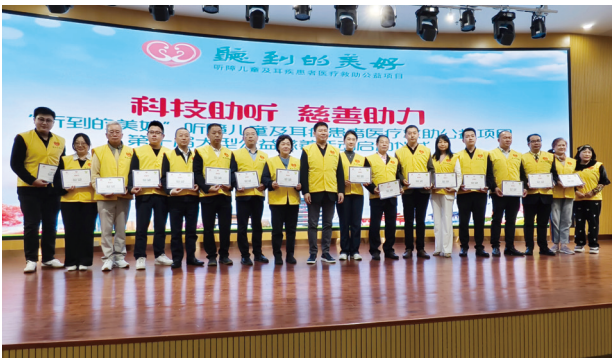
● 本集團中國公益組支持惠州的聽障兒童及耳疾患者醫療救助公益項目