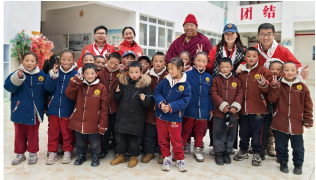
● 本集團中國公益組慰問四川塔公木雅多繞嘎目學校的學生