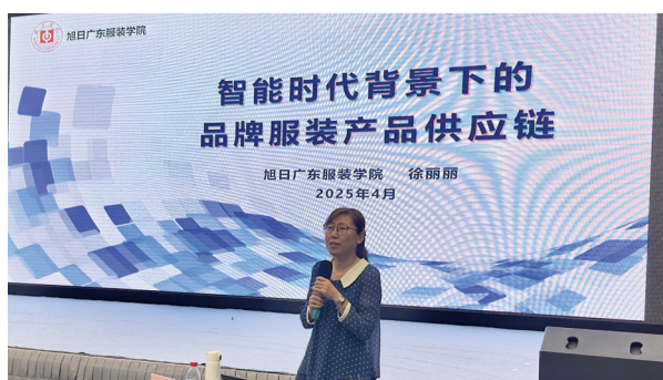
● 「智能時代背景下的品牌服裝產品供應鏈」課程