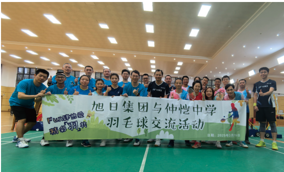
● 本集團羽毛球隊與仲愷中學老師們比賽交流