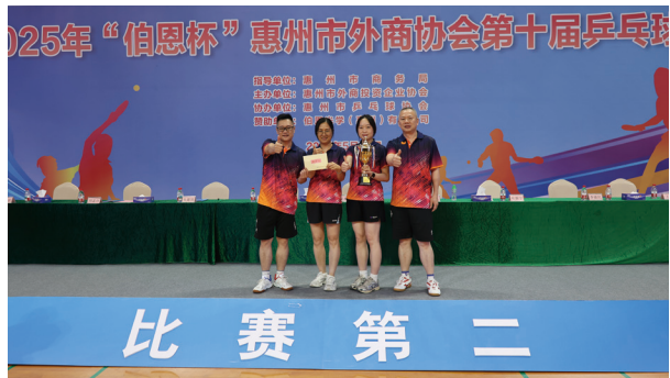
● 本集團乒乓球隊參加比乒乓球比賽獲得佳績