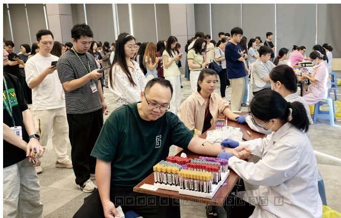
● 中國總部舉行每年一次的健康體檢

本集團每年均舉辦防火演習及簡介會，令員工熟悉火警逃生路線及掌握最新知識。另外，本集團於2025年舉辦了多個不同主題的健康推廣活動，包括在中國總部進行每年一次的員工健康體檢；在香港總部，舉辦了「鬆一鬆：紓緩辦公室痛症伸展運動班」，邀請了香港註冊物理治療師進行分享，讓員工認識常見的辦公室痛症，應對久坐辦公帶來的挑戰，提升工作與健康的平衡，及「呼吸自在禪」課程，讓員工在急速的工作與生活節奏中，透過禪修實踐，學習觀察呼吸，從而提升專注力、情緒管理能力及內心平衡。本集團還會定期透過《每月培訓資訊》電郵，分享不同機構主辦的免費講座，涵蓋精神健康、辦公室運動小錦囊、健康／養生資訊等，讓員工自行按興趣參與。