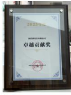
四川文轩在线 电子商务有限公司 2025年卓越贡献奖