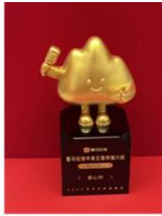
喜马拉雅 年度主播传播力奖 全网种草推荐官