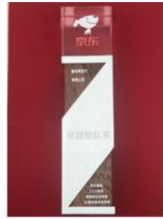
京东 2025年卓越团队奖