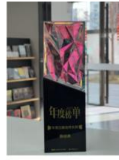
腾讯音乐娱乐集团 2025年度出版合作伙伴