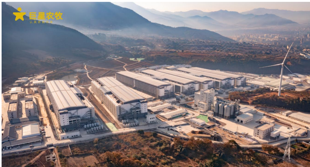
图 2：巨星农牧现代化楼房猪场

此外，现代化生猪养殖行业已从传统的育肥逐渐延伸至集基因筛选、种猪选育、动物疫病防治、科学饲料配比等跨越多体系、多学科的系统性工程，市场参与者需综合考量育种效率、料肉