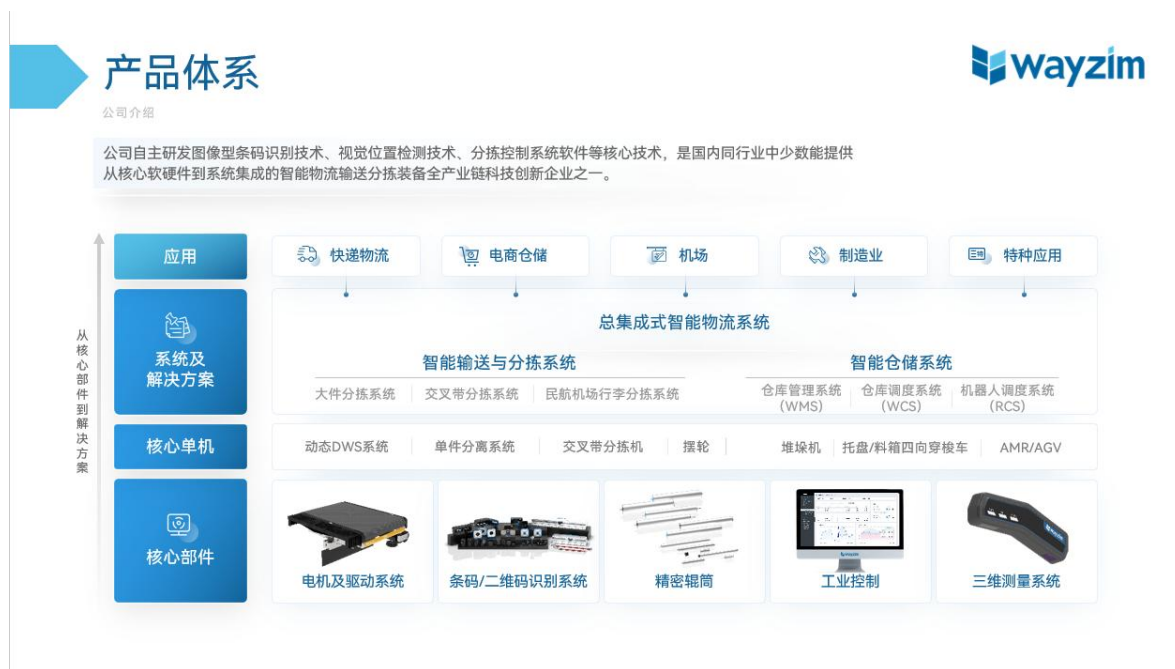
图：中科微至产品矩阵示意图

秉承“科技创新、匠心品质”的精神，中科微至引领行业科技创新，中科微至的产品体系涵盖输送、分拣、仓储、搬运四大组成部分，为客户提供面向智能分拣、智能仓储、行李分拣综合解决方案，以及智能视觉、电动辊筒两大核心部件产品。公司的交叉带、摆轮、窄带等分拣单机实现了从小件、大件到重载件的全面分拣；叠件分离、单件分离、居中机等配套单机实现了分拣流程的全自动化；堆垛机、穿梭车、重载机器人等仓储单机可实现仓配一体流程的全自动化。