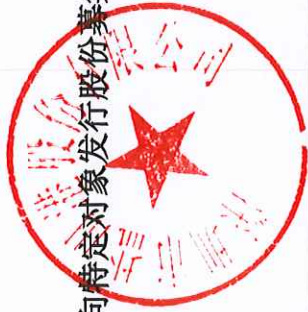
附表 1-2 (2024 年向特定对象发行股份募集配套资金) :