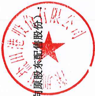
附表 1-1 (2020 年向原股东配售股份)