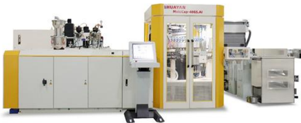
图 3.1.1 公司 2025 年研发的全新瓶盖压塑成型系统

本报告期，公司对 Epioneer 系列瓶坯智能成型系统进行了大的技术更新。公司还研发并制造了全新的瓶盖压塑成型系统，目前处于市场推广阶段。