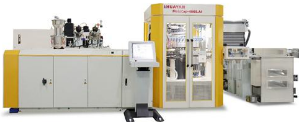
图 3.1.1 公司 2025 年研发的全新瓶盖压塑成型系统

本报告期，公司对 Epioneer 系列瓶坯智能成型系统进行了大的技术更新。公司还研发并制造了全新的瓶盖压塑成型系统，目前处于市场推广阶段。