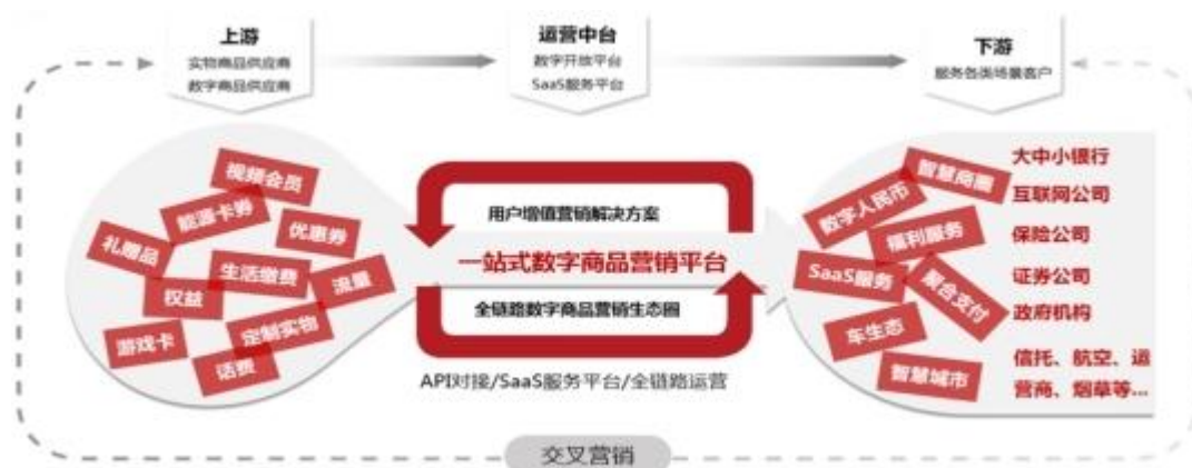
图一：数字生活营销业务基本模式

以一站式数字生活营销解决方案为核心产品，聚合数字化产业上下游资源，打造数字化营销服务中台，通过专业级的数字商品分发引擎和营销活动引擎，构建数字生活营销生态体系，实现用户价值的深度挖掘和持续增长。公司持续致力于为客户提供用户生命全流程运营管理服务，与国内头部金融机构均保持较稳定的合作关系，包括中国银联等卡组织、五大国有银行、头部股份制银行及其他商业银行，中国人保、太平洋保险等头部保险公司，以及各类基金、券商、信托等非银金融机构；同时，公司也是微信、支付宝、美团等大型互联网平台的优质服务商。