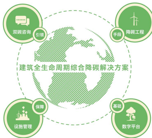
延华绿色双碳与数字能源业务全生命周期综合降碳管理和服务

报告期内，公司以“安全、健康、绿色、智能”为核心战略导向，深度推动节能降碳服务与数字化、智能化技术的融合创新，聚焦建筑全生命周期场景，构建并开展双碳咨询、数字能源、降碳工程、智慧运营于一体的综合服务与运营体系。在“双碳”国家战略深入推进的背景下，公司聚焦绿色双碳与数字能源核心业务，重点布局公共机构、重点用能单位及大型建筑核心领域，依托全生命周期综合降碳管理服务模式，全面覆盖碳审计、碳核算、碳监测、碳报告、碳交易、碳清缴等碳资产管理全流程，切实助力客户实现双碳目标，推动行业绿色低碳转型落地见效。