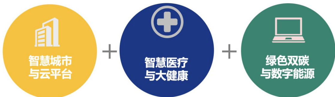
延华智能三大业务领域

报告期内，公司继续围绕“智慧城市、智慧医疗建设、运营和服务的综合提供商”的战略定位，聚焦智慧城市与云平台、智慧医疗与大健康、绿色双碳与数字能源三大业务板块，提供“安全、智能、绿色、健康”的全生命周期建设、运营和管理服务。作为智慧城市领域持续拓展耕耘的高科技企业，秉承“分享、合作、创造”的文化理念，通过各项技术的应用及多年来行业经验积淀，钻研探索各类创新解决方案，赋能智慧城市各领域的管理与服务。