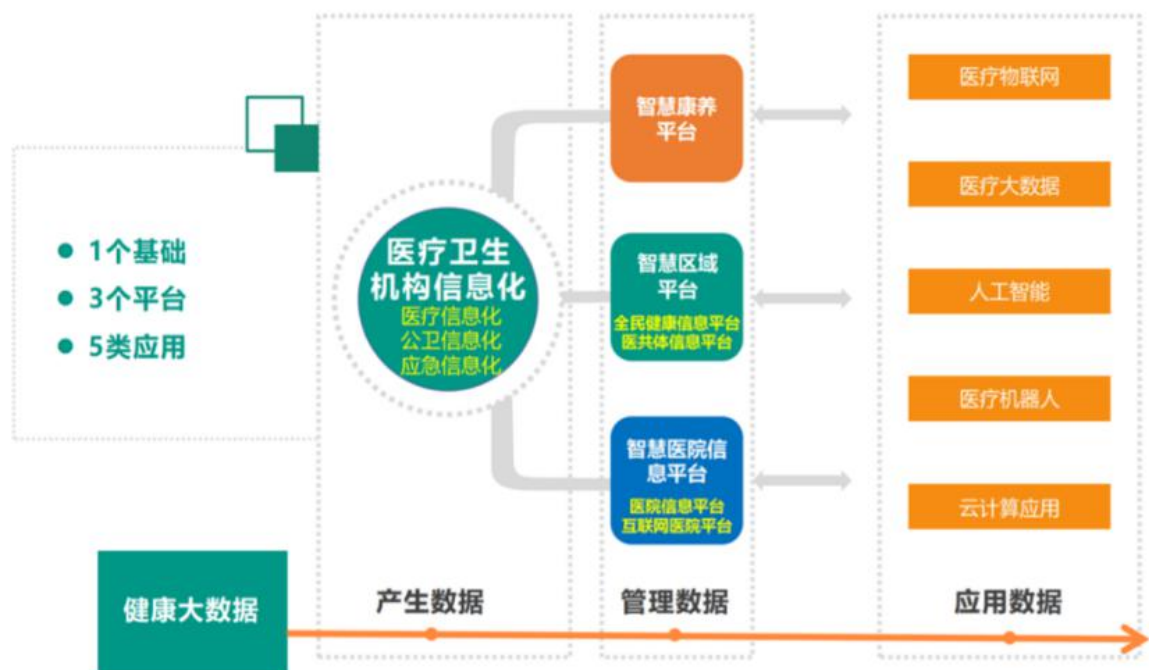
延华智慧医疗与大健康业务“1+3+5”的发展战略

智慧医院平台： 主要面向各级医院，建设电子病历、智慧服务、智慧管理“三位一体”的智慧医院信息系统，提供个性化智慧医院全生命周期整体解决方案。通过数据标准化、流程简化、服务智能化，重点解决医院内医疗数据质量不高、业务协同复杂、服务模式老化等问题，不断提升医院管理水平和服务能力。对医院建筑及基础设施进行智能化设计、实施与改造，为医院建设提供医疗辅助智慧服务。