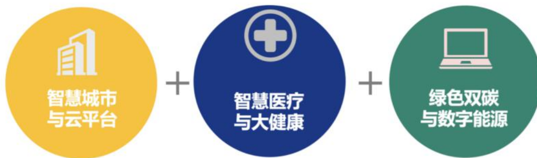
延华智能三大业务领域

报告期内，公司继续围绕“智慧城市、智慧医疗建设、运营和服务的综合提供商”的战略定位，聚焦智慧城市与云平台、智慧医疗与大健康、绿色双碳与数字能源三大业务板块，提供“安全、智能、绿色、健康”的全生命周期建设、运营和管理服务。作为智慧城市领域持续拓展耕耘的高科技企业，秉承“分享、合作、创造”的文化理念，通过各项技术的应用及多年来行业经验积淀，钻研探索各类创新解决方案，赋能智慧城市各领域的管理与服务。