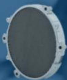
微通道低空飞行器 散热器

Microchannel Radiator for Low-altitude Aerial Vehicles