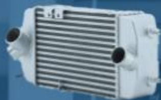
高性能全铝中冷器

High-performance All- aluminum Intercooler