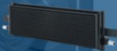
微通道双层油冷器