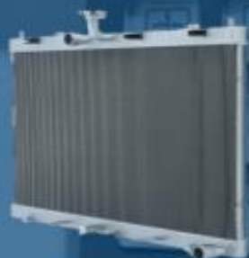
高性能全铝散热器

High-performance All- aluminum Intercooler