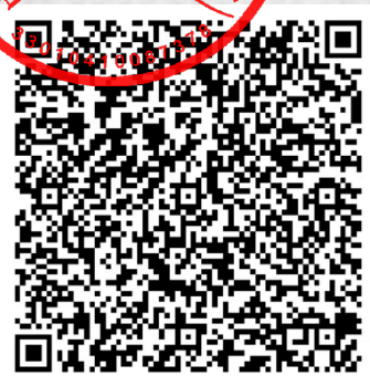
虞浩东年检二维码