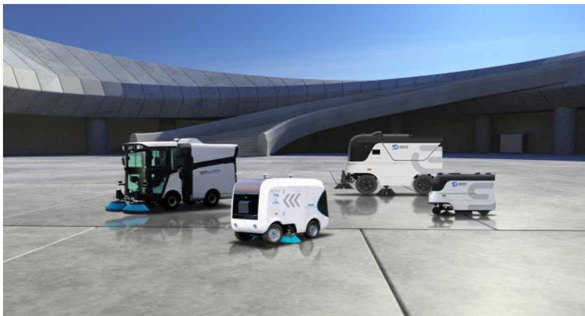
图 4：部分无人驾驶产品