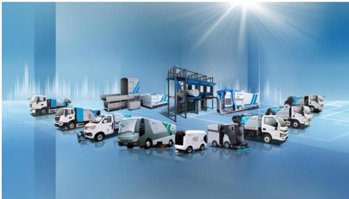
图 2：部分智能装备产品

(3) 核心技术自主可控。核心技术自主化与核心部件自主设计能力的掌握，不仅是公司研发实力显著提升的重要标志，更能有效突破行业技术壁垒，显著增强产品的市场竞争力。同时，这一能力可实现对产品制造成本的精准管控，助力企业摆脱对单一供应商的依赖，降低价格波动、交付周期、定制化需求等因素对产品交付的不利影响。此外，通过自主设计核心部件，企业能够掌握完整的技术图纸与维修方案，为市场提供全面完善的售后服务，从而有力保障公司生产经营的持续稳定。2025 年，公司申请专利 11 项（其中发明专利 9 项），新增获得授权发明专利 2 项，累计获得发明专利 22 项。报告期内，公司已完成“分体式”移动站、“智能化”上装控制系统、“无人化”智能转运站等项目的研发工作。