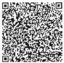
游泽侯年检二维码