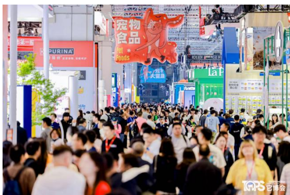
2025 TOPS 它博会