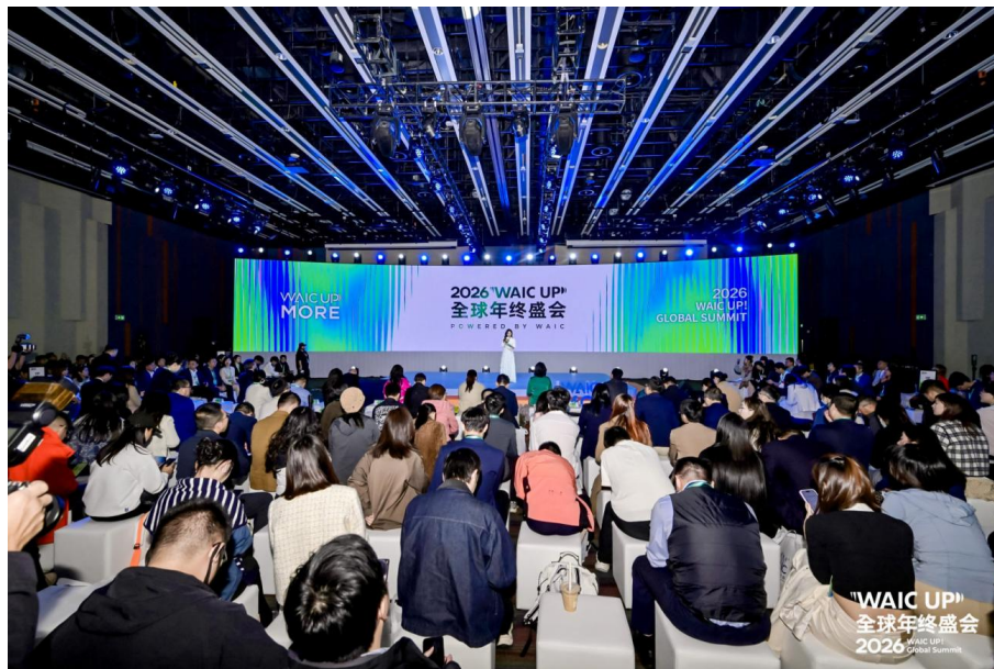
WAIC UP! 全球年终盛会

2026 年，公司将加快“走出去”步伐，以重点 IP 项目为牵引，推进海外业务落地。WAIC 于 2026 年 1 月在香港举办年度旗舰活动“WAIC UP! 全球年终盛会”，并将再度与新加坡 AIMX 合作于新加坡金沙会展中心举办海外活动，持续扩大国际影响力。工博会打造“CIIF+”品牌战略，将首次出海办展，落地泰国，举办东南亚（泰国）智能制造展览会（IME），依托东南亚作为全球制造业转移核心区域的区位优势与政策红利，开拓区域市场。广印展与中亚贸易展览公司联合举办的上海国际广印展·哈萨克斯坦站将于阿塔肯特国际展览中心举办，实现合作落地。公司将依托香港公司，统筹海外项目运营与资源对接，推动核心 IP 从国内走向海外。