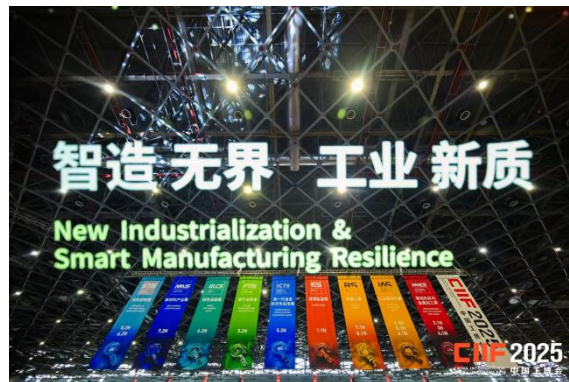
第 25 届中国国际工业博览会