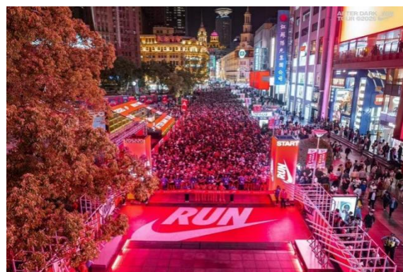
2025 耐克女子夜跑上海 10K