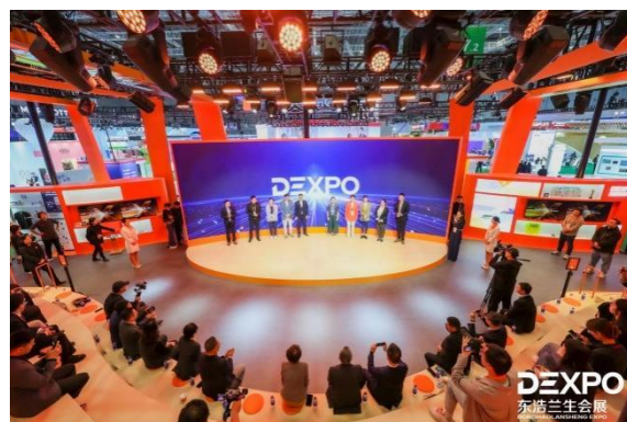
进博会 DEXPO 展台

公司积极参与筹备世界技能大赛、世界无线电通信大会等具有全球影响力的国际赛事与会议。公司发挥整体协同与专业服务优势，统筹旗下各子公司设立跨部门协同机制，负责第 48 届世界技能大赛运营保障、主场搭建、物流保障、商赞服务、大活动、接待保障等相关筹备工作。公司参与 2027 世界无线电通信大会前期考察接待及 ITU 第四研究组会议筹备，助力我国于 2025 年成功获得 2027 年世界无线电通信大会会议的主办权。同时公司承办首次在中国落地的 2025 世界赛艇锦标赛，代表国家彰显上海赛事组织能力与创新水平。