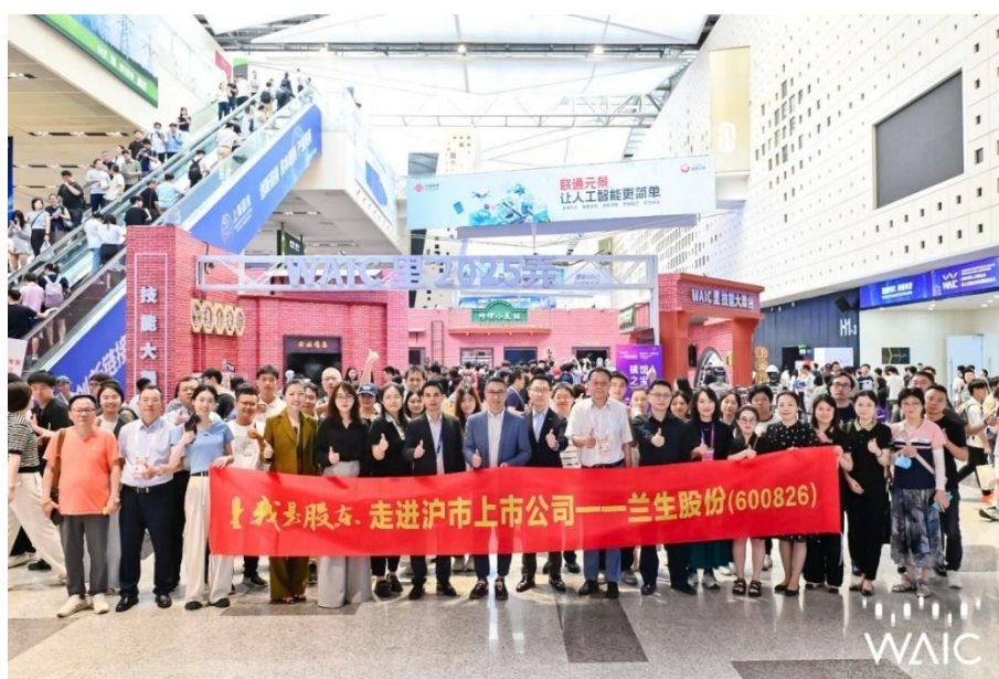
走进上市公司活动（WAIC 现场）

投资者关系工作精准深入。全年策划、组织、参与各类交流活动近 50 场，创新打造“走进展会现场”沉浸式投关形式，年度业绩说明会直播浏览量超 13 万次。组织多场“走进展会现场”的沉浸式投关活动，在“2025 世界人工智能大会（WAIC）”“它博会”“低空经济博览会”等重要展会项目期间，邀请投资者实地调研。