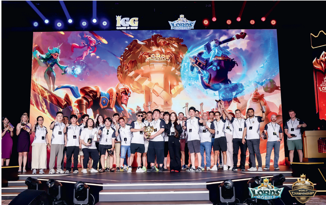
《王國紀元》二零二五全球巔峰賽