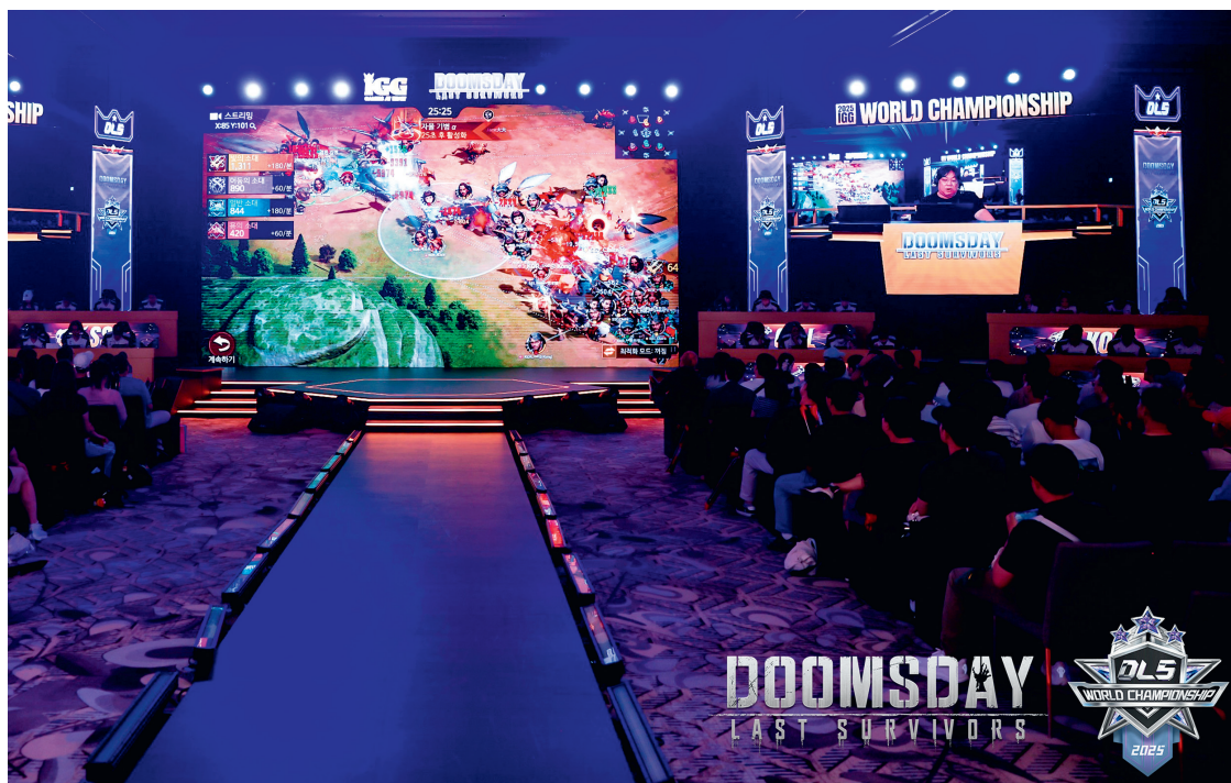
《Doomsday: Last Survivors》二零二五全球巔峰賽

二零二五年，我們持續深耕玩家體驗，精心籌劃並開展了一系列豐富多彩的玩家互動活動，覆蓋全球多個國家和地區，既打造了殿堂級電競盛宴，也搭建了親密便捷的玩家溝通橋樑。《王國紀元》、《Doomsday: Last Survivors》與《Viking Rise》三大旗艦遊戲強強聯合，共同打造年度電競盛事「二零二五全球巔峰賽」。三大遊戲開啟覆蓋全球的激烈選拔，歷經數月線上鏖戰與數千支隊伍層層海選，來自世界各地的頂尖選手脫穎而出，齊聚韓國仁川角逐冠軍榮譽與重磅獎池。本屆賽事帶來多種創新賽制與玩法，兼具戰術深度與觀賞性，現場更設有豪華觀賽團、沉浸式互動體驗等豐富環節，為全球玩家帶來頂級競技與觀賽盛宴。此外，我們還在全球各主要城市舉辦了特色各異的線下見面會、主題活動與遊戲展參展，與全球玩家深度互動。