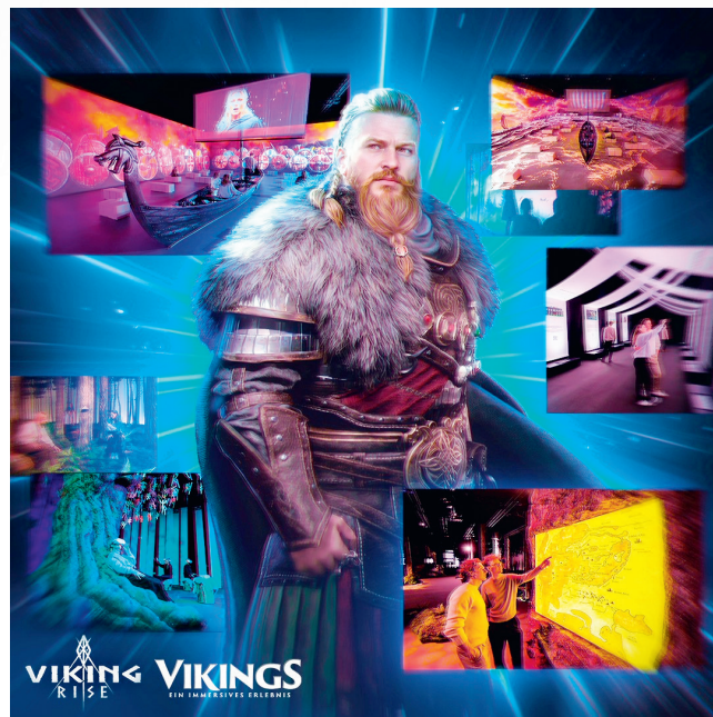
《Viking Rise》與「維京－探險者與征服者」沉浸式展覽合作