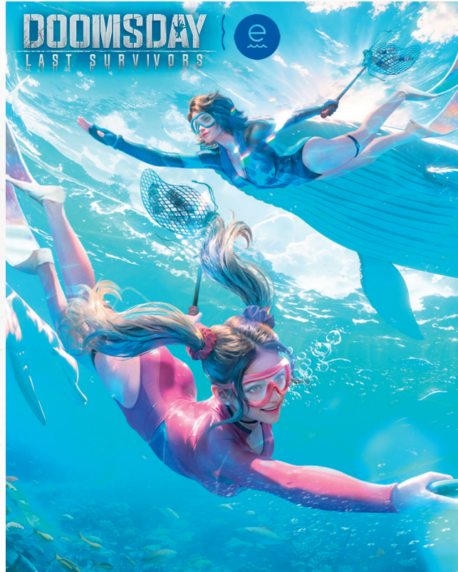
《Doomsday: Last Survivors》攜手Ecomar開展保護海洋活動