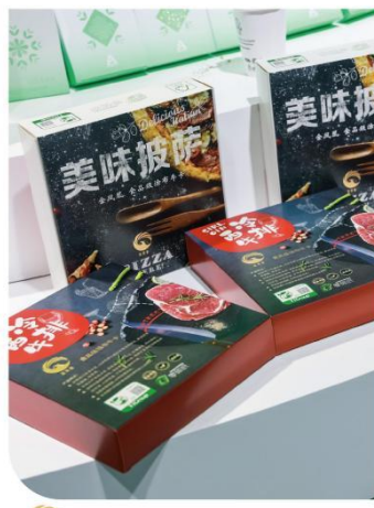
食品级涂布牛卡纸 CBKB