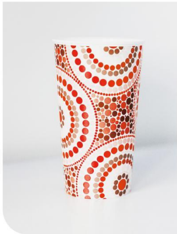
食品级涂布白卡纸 PCC