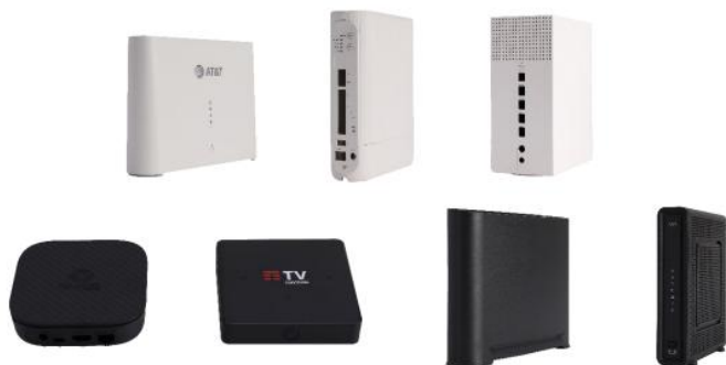
- 机顶盒/网关 -