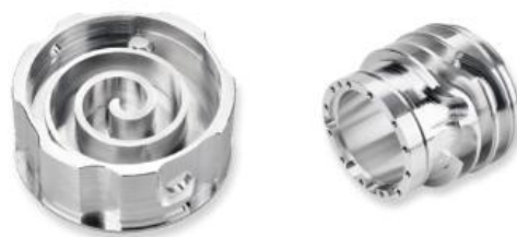
机器人零部件及新能源车高精密零部件