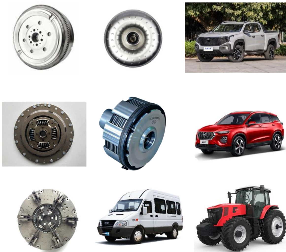
车辆核心传动部件及应用场景